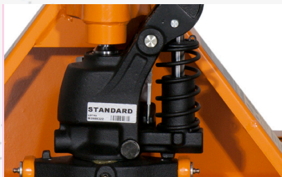
La nouvelle conception améliore la performance et la fiabilité