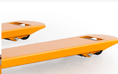
La conception de la pointe de la fourche permet le déplacement en douceur de la palette

En raison de l'amélioration continue des produits, les spécifications peuvent être modifiées sans préavis ni obligation. Certains des systèmes et caractéristiques illustrés sont offerts en option, moyennant des frais supplémentaires. Lift-Rite est une marque commerciale américaine de Lift-Rite.