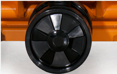
Des roues, des rouleaux et des roulements à billes de haute qualité

L'alliage du confort et de la puissance. Tout ça grâce à des roues et des rouleaux en nylon non marquant, et des roulements à billes blindés qui aident l'opérateur à transporter confortablement de lourdes charges.